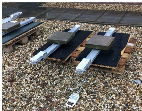
Meting wrijvingscoëfficiënt voeten